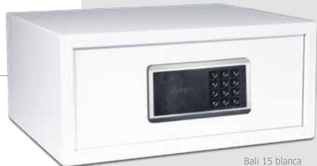
Bali 15 blanca