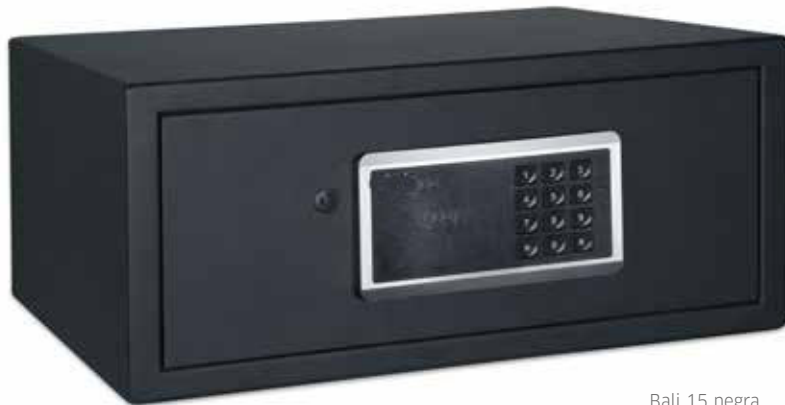
Bali 15 negra