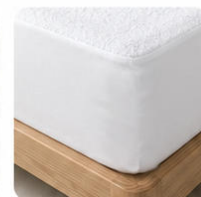
Faldón de ajuste