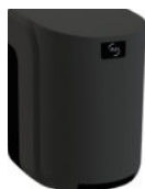
Cleanline Boquilla central maxi negro UL 1 : 6