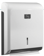
Cleanline Zig-zag carcasa blanca UL 1 : 8