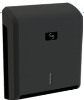
Cleanline Zig-zag carcasa negra UL 1 : 8