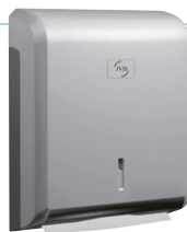
Cleanline Zig-zag carcasa gris metalizada UL 1 : 8