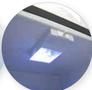
Iluminación interior Interior lighting