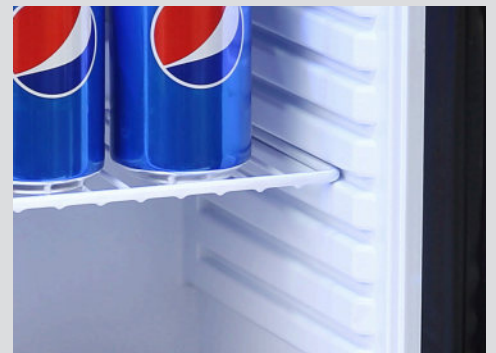
Bandejas regulables en altura