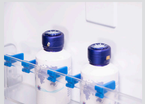
Botelleros con separadores en el interior de la puerta