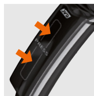
SISTEMA DE ENCENDIDO PATENTADO