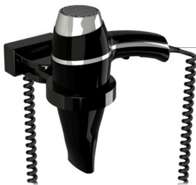
REF 8 22 1626 Alteo negro + soporte universal negro