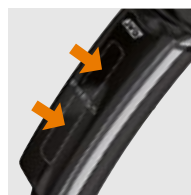
SISTEMA DE ENCENDIDO PATENTADO