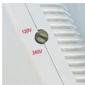
2 POSICIONES DE TENSIÓN