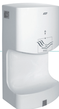
REF 8 11 707 Airwave automático blanco