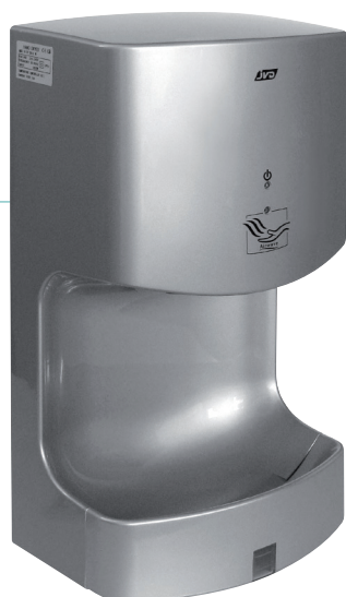
REF 8 11 684 Airwave automático gris metalizado