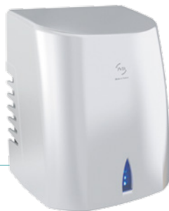
REF 8 11 1168 Copt'air automático aluminio gris metalizado UL!: 4