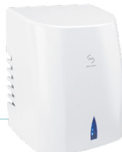
REF 8 11 1167 Copt'air automático aluminio blanco UL!: 4

+ REF 5 30 1899 Filtro antibacteriano UL!: 1