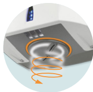
INNOVACIÓN BOQUILLA GIRATORIA PARA MEJOR EFICACIA Y NUEVA SENSACIÓN

+ REF 5 30 1899 Filtro antibacteriano UL!: 1