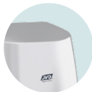
ANTIVANDÁLICA CARCASA DE ALUMINIO