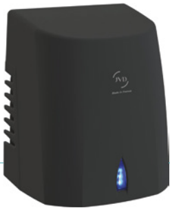
REF 8 11 1377 Copt'air automático aluminio negro UL!: 4