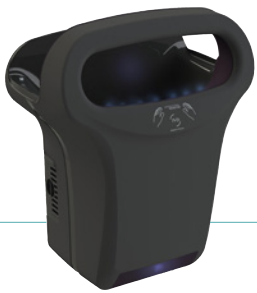
REF 8 11 1376 Exp'air automático negro epoxi UL 1 : 1