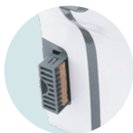
HIGIÉNICO FILTRO DE COBRE BACTERICIDA Y DEPÓSITO DE AGUA INTEGRADOS, TRATAMIENTO ANTIBACTERIANO DE LAS SUPERFICIES