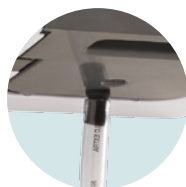
EVACUACIÓN DIRECTA CONEXIÓN AL DESAGÜE POSIBLE GRACIAS AL KIT EVACUADOR INCLUIDO