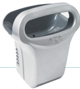
REF 8 11 822 Exp'air automático aluminio gris epoxi UL 1 : 1