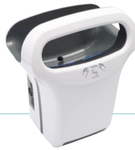
REF 8 11 791 Exp'air automático aluminio blanco epoxi UL 1 : 1

+ REF 5 90 2014 Filtro de cobre Bactericida UL 1 : 1